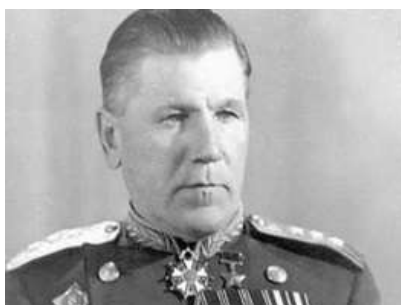
Алекса́ндр Васи́льевич Горба́тов (1891—1973)

Боевые действия 9-й танковый корпус начал, находясь в оперативном подчинении Командующего 3-й Армии генерала А. В. Горбатова.