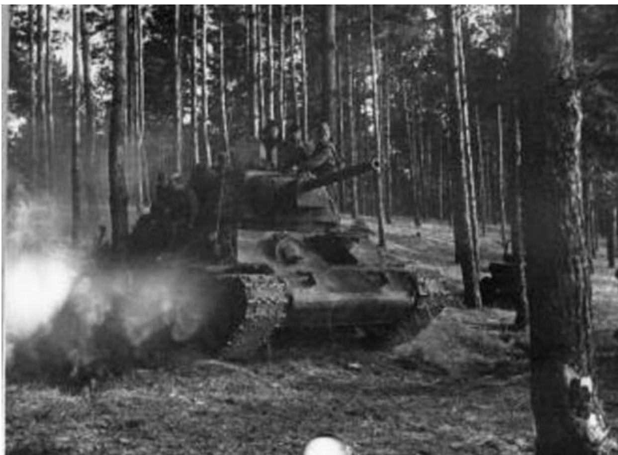
Т-34 23-й тбр 9-го тк 23.09.1943 г.

В Днепровской битве 9-й танковый корпус взаимодействовал с соединениями 65-й Армии генерала П. И. Батова, первыми из войск фронта форсировавшими р. Днепр и захватившими плацдарм на его западном берегу в районе г. Лоева. Для расширения плацдарма был привлечен и 9-й танковый корпус.