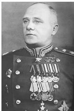
Семён Ильич Богданов (1894-1960) маршал бронетанковых войск (1 июня 1945), дважды Герой Советского Союза

В боях на Курской дуге 9-м танковым корпусом командовали генерал С. И. Богданов (впоследствии маршал бронетанковых войск)