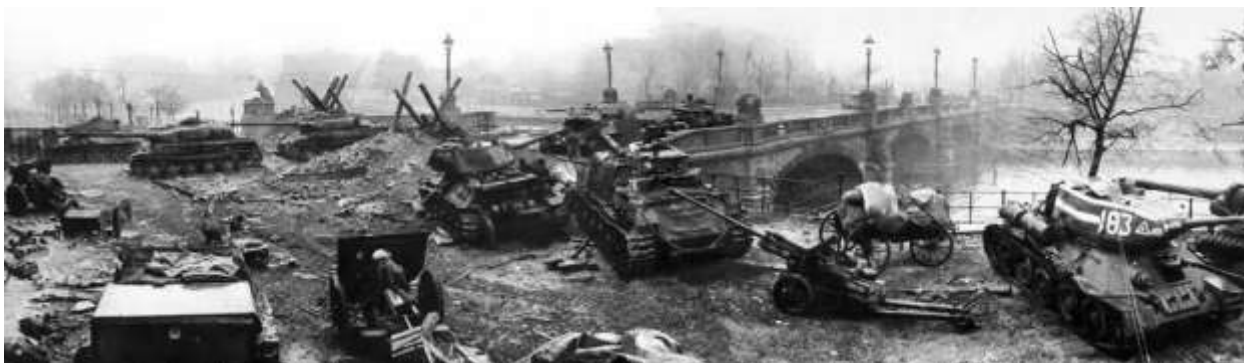
Бронетехника 9-го тк в районе Рейхстага, мост Мольтке. Т-34-85 из 23-й тбр 9-го тк, а ИС-2 из состава 85-го гв. тп. Берлин, май 1945 г.

23, 95 и 108 танковые бригады корпуса и 1455 самоходно артиллерийский полк действовали в качестве танков и САУ непосредственной поддержки пехоты стрелковых соединений 3-й ударной Армии.