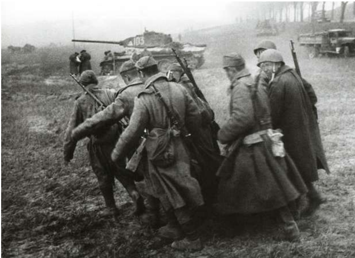
Танки Т-34-85 в наступлении.

врага. Противник не выдержал их стремительного удара и стал отходить на запад. За день боев корпус продвинулся на 18 километров. Это позволило войскам 65 Армии успешно завершить бои по расширению плацдарма. Продолжая наступление на правом берегу Днепра, корпус истребил свыше 4000 гитлеровцев. 14 ноября 1943 года 9-й танковый корпус (без 23 тбр) был выведен в резерв Командующего фронтом. 23 танковая бригада участвовала в освобождении г. Речицы, за что получила почетное наименование и стала именоваться «Глухово-Речицкой».