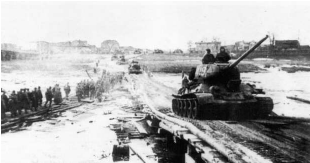
Танки Т-34-85 в наступлении. Январь 1945 г.

Освободив от немецко-фашистских войск города Калиш, Вольштин и другие, 9-й танковый корпус 28 января 1945 года вышел на линию польско-германской границы 1939 года и вторгся в пределы Бранденбургской провинции.