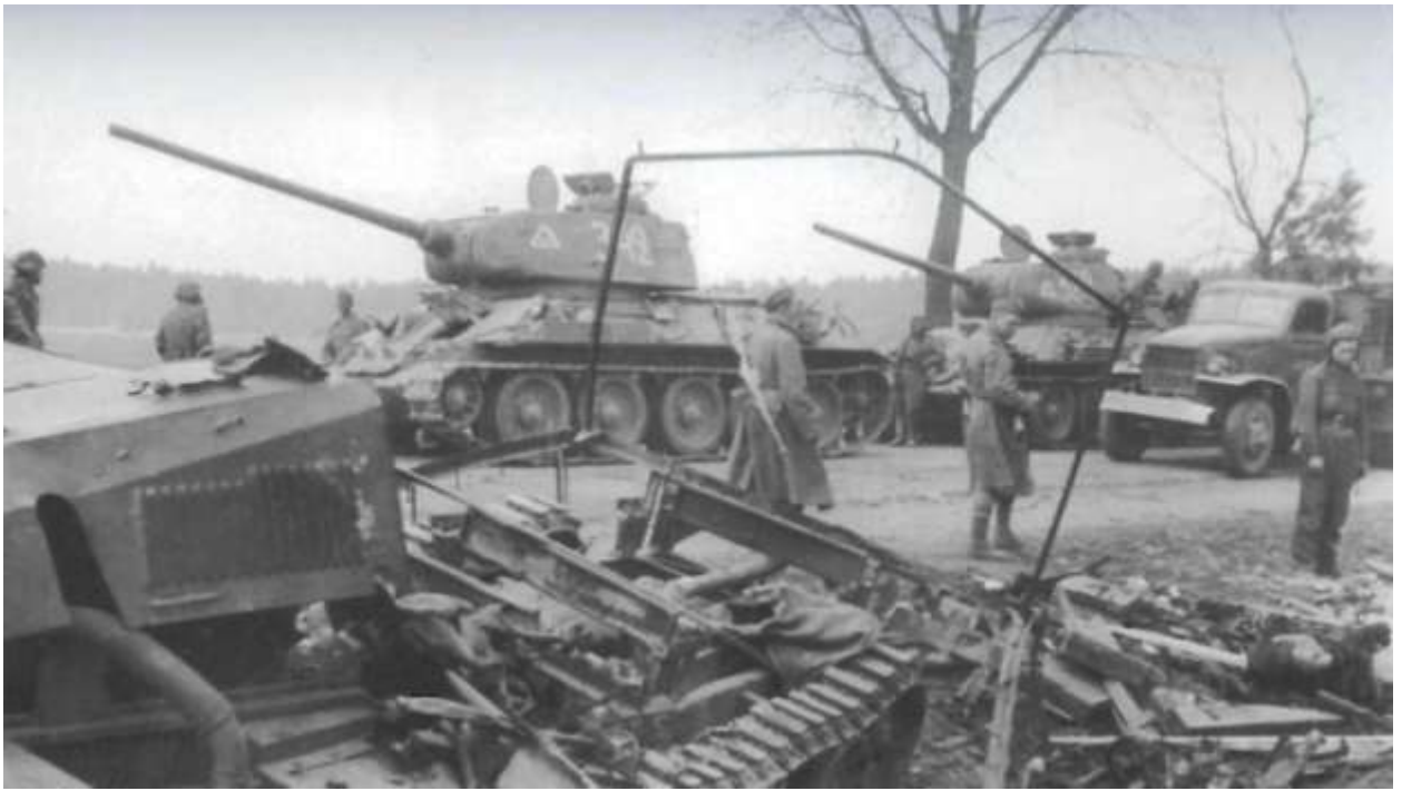
Берлин, май 1945 г

Танкисты 9-го танкового корпуса в боях на подступах к фашистской столице и при штурме Берлина взяли в плен около 7000 гитлеровских солдат и офицеров.