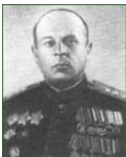
Куркин Алексей Васильевич (1901— 1948) советский военачальник, генерал-полковник танковых войск (1944).

С мая по сентябрь 1942 года корпус возглавлял генерал А. В. Куркин.