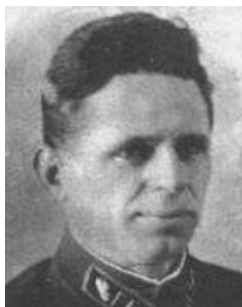
Командир 9-го танкового корпуса генерал-майор танковых войск