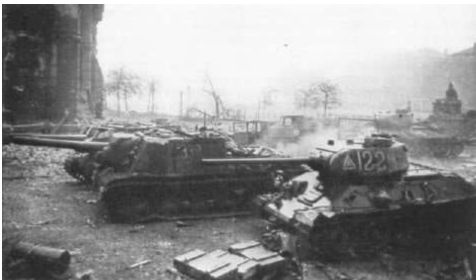
Бронетехника 9-го тк в районе Рейхстага. Берлин, май 1945 г.

За отличные боевые действия на подступах к фашистской столице всему личному составу корпуса Верховный Главнокомандующий объявил благодарность.