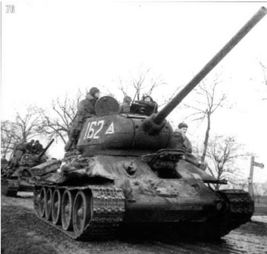
Колонна Т-34-85 № 162 9-го тк на подступах к Штеттину. Германия, февраль 1945 г.

В ходе наступления танкисты корпуса разгромили остатки пяти, двух танковых и механизированной дивизий, две бригады штурмовых орудий, несколько охранных и курсантских батальонов унтер-офицерских школ, и первыми вышли к р. Одер. На участке 1-го Белорусского фронта.